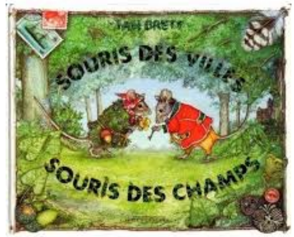
L'occasion de débiter l'analyse grammaticale avec les CE 1 ...